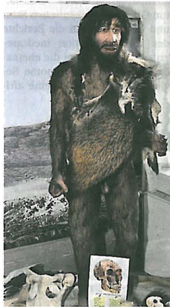
Mit Wissen und Handwerk setzte sich die Menschheit durch.

Gießen. Gemeinsam mit einigen Bürgerreportern ist erneut eine spannende Reise durch die Gießener Urzeitwelt veranstaltet worden. Mit dabei war auch diesmal die GIEßENER ZEITUNG. Dieses Mal ging es jedoch nicht nur